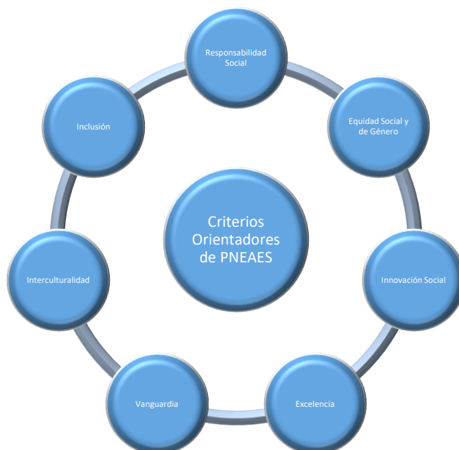
Gráfico 1. Criterios Orientadores del PNEAES

En la gestión de la dirección actual se han implementado acciones de reconocimiento de la situación (diagnóstico) actual de la Unidad 161, Morelia. En esto se aplicó un ejercicio en el cual se pretendió reconocer la realidad institucional a partir del marco general de autoevaluación del SEAES, para el desarrollo de este ejercicio se tomaron en cuenta los elementos de: